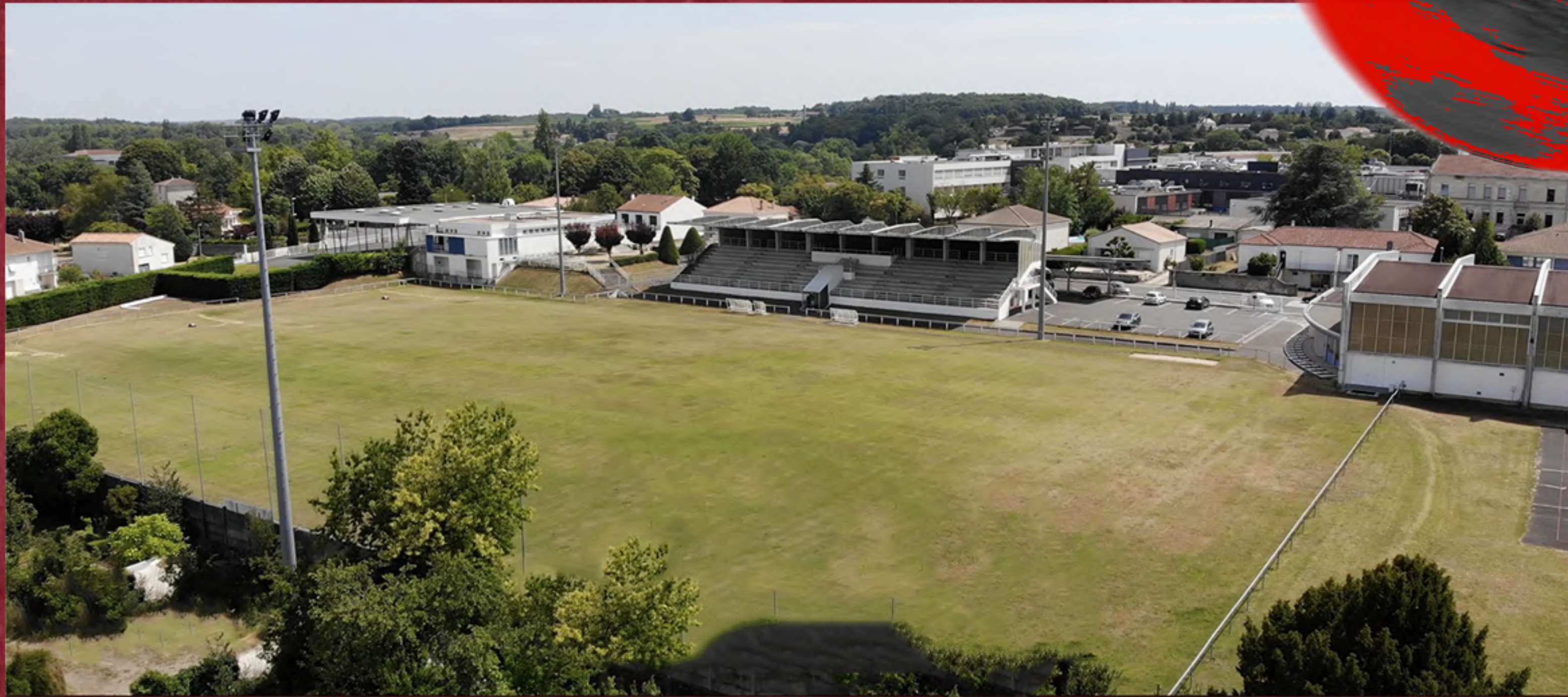
STADE MUNICIPAL DE JONZAC